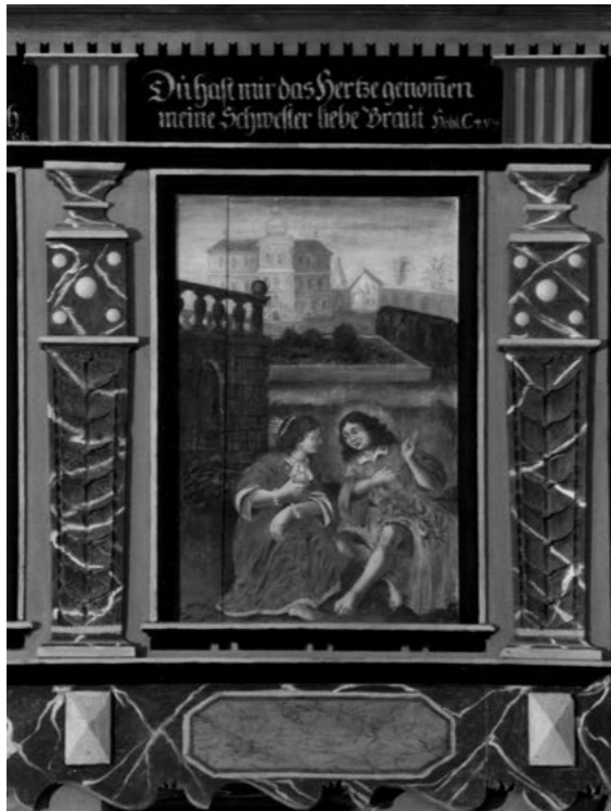
7. Steinhagen, empora południowa, kwatera z dekoracją malarską, ok. 1670–1680.

stus ratuje z więzów śmierci (emblem I 9). Zamiast motta z Ps 116, 6 znalazły się tutaj wyrażające podobną myśl słowa z Ps 116, 3–4 35 , potwierdzające niewątpliwie fakt posłużenia się jedną z parafraz Hugona, jak choćby Emblemata sacra Hoburga (1661) 36 . Jednakże niezależnie od zmian, które w tym przypadku mógł zalecić miejscowy pastor, również same picturae w pismach autorstwa protestanckich duchownych przechodziły podobną ewolucję, by później znaleźć się w przestrzeni kościelnej 37 . Na inspirowanie się różnymi wzorcami wskazują niewątpliwie odmienne wersje picturae do emblematu III 12 (z mottem z Ps 42, 2b), odnoszącego się do pragnienia oglądania Zbawcy.