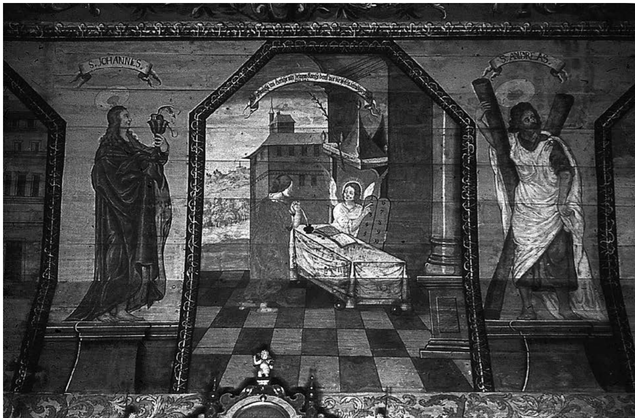
4. G. Hintz, dekoracja malarska sklepienia pozornego, 1693–1696, Mühlhausen (Gwardiejskoje). Fot. archiwalna, R. Schulze-Marburg, 1943/1944, Bildarchiv Foto Marburg

tem Ps 42, 2b: „Kiedyż przyjdę, a okażę się przed obliczem Bożem?”, oraz II 14, z Ps 84, 1–2: „O jako są miłe przybytki twoje, Panie zastępów! Żąda i bardzo tęskni dusza moja do sieni Pańskich; serce moje i ciało moje pochutniwa sobie do Boga żywego”) wskazują na oglądanie Boga w niebie jako konsekwencję zjednoczenia duchowego ze Stwórcą. Idea ta została zaakcentowana dobitnie, ponieważ w polu centralnym całego stropu widnieje monumentalna kompozycja na podstawie ryciny Johanna Sadelera starszego według Pietera de Wittego zwanego Candidem, przedstawiającej muzykujące chóry anielskie oraz grającą na pozytywie św. Cecylię, adorujących Boga w niebiosach 28 .