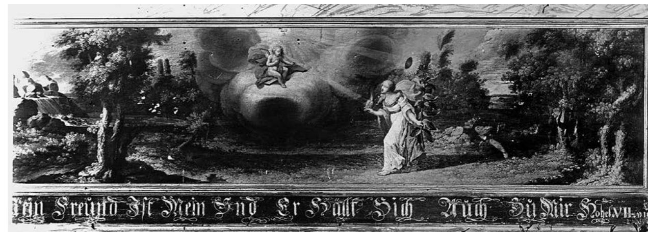
3. Kościelec, kwatery z malarskiej dekoracji empory, ok. 1698.

Innym przykładem jest wspomniana empora w Katharinenheerd, zawierająca 14 scen uporządkowanych w tej samej kolejności co w pierwowzorze książkowym. Otwiera go wstępny emblemat (z mottem z Ps 38, 5), wizualizujący pełne łez wdychanie Duszy, pragnącej pojednać się z Bogiem. Obrazy pochodzą głównie z Księgi I (wykorzystanej niemal in extenso ), skoncentrowanej wokół sposobów, w jaki Boska Miłość napomina i instruuje grzeszną Oblubienicę, która pod wpływem ziemskich pokus próbuje się wstrzymać od wejścia na via salutis 23 . Kompozycjom tym towarzyszą dwie płyciny z picturae zaczerpniętymi z Księgi II i wizualizującymi nawrócenie: Anima odwracająca się od miłości ziemskiej i kierująca się ku Oblubieńcowi (emblemat II 1, z werselem Ps 119, 167: „Przestrzega dusza moja świadectw twoich;