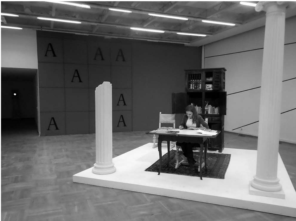
il. 2 Fragment ekspozycji „Bohdan Butenko – Książkę robi się jak sweter” (25 X – 10 XI 2013, Bunkier Sztuki, Kraków).

W opisywanej sali znalazły się także gabloty z nielicznymi oryginałami makiet pojedynczych stron z zeszytów kwapiszonowych i z publikacji O książce . Można było także przekartkować materialne egzemplarze rozłożone na szerokich, wygodnych stołach albo wypożyczyć sobie z biblioteczki (zaaranżowanej w drugiej, otwierającej wystawę, przestrzeni) którąś z bez mała 200 książek, zgromadzonych na tę ekspozycyjną okoliczność w zabytkowej szafie. Biurko na postumencie flankowały wspomniane wcześniej kolumny.