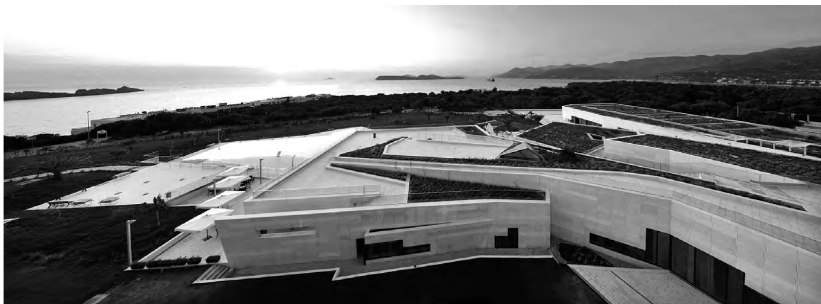
Il. 5. Hotel Valamar Lacroma Resort, Dubrownik.