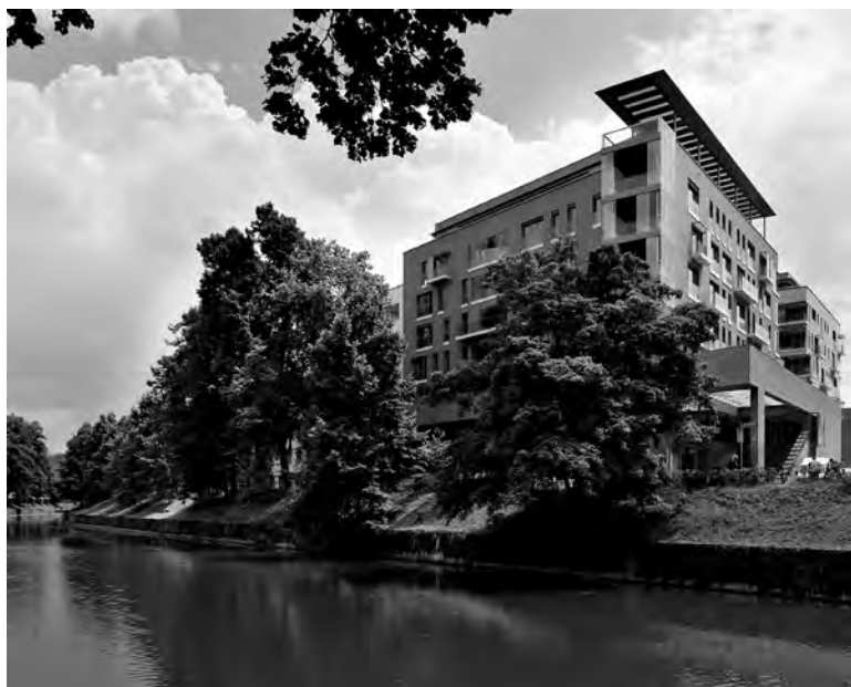
Il. 4. Vila Urbana, Lublana.

sycyzowanie, poza wszelkimi modnymi tendencjami i kierunkami. „Fürchte nicht, unmodern gescholten zu werden [Nie bój się być okrzykniętym nienowoczesnym]” – jak głosił ok. 1910 r. Loos 3 . W tym miejscu niniejszych rozważań należy jeszcze raz postawić pytanie: czy artysta tak ukształtowany jak Podrecca może być wprost zakwalifikowany do jednego z głównych nurtów architektury drugiej połowy XX wieku? Należy raczej przyjąć, jak uczynił to Prelovšek, że w owym okresie zaszły warunki pozwalające na równoczesne funkcjonowanie różnych stylów, „nawet i takich, które [...] przeciwstawiają się logicznej tektonice, gdyż nie istnieje jednolita filozofia umożliwiająca ich obiektywną ocenę” 4 . „Świadomość świadomości” oznacza także, że w założeniach teoretycznych Podrecci zawarty jest duży element niestabilności, ujawniający się w skłonności do wypróbowywania nie tylko odleglejszych, lecz również całkiem współczesnych podejść architektonicznych.