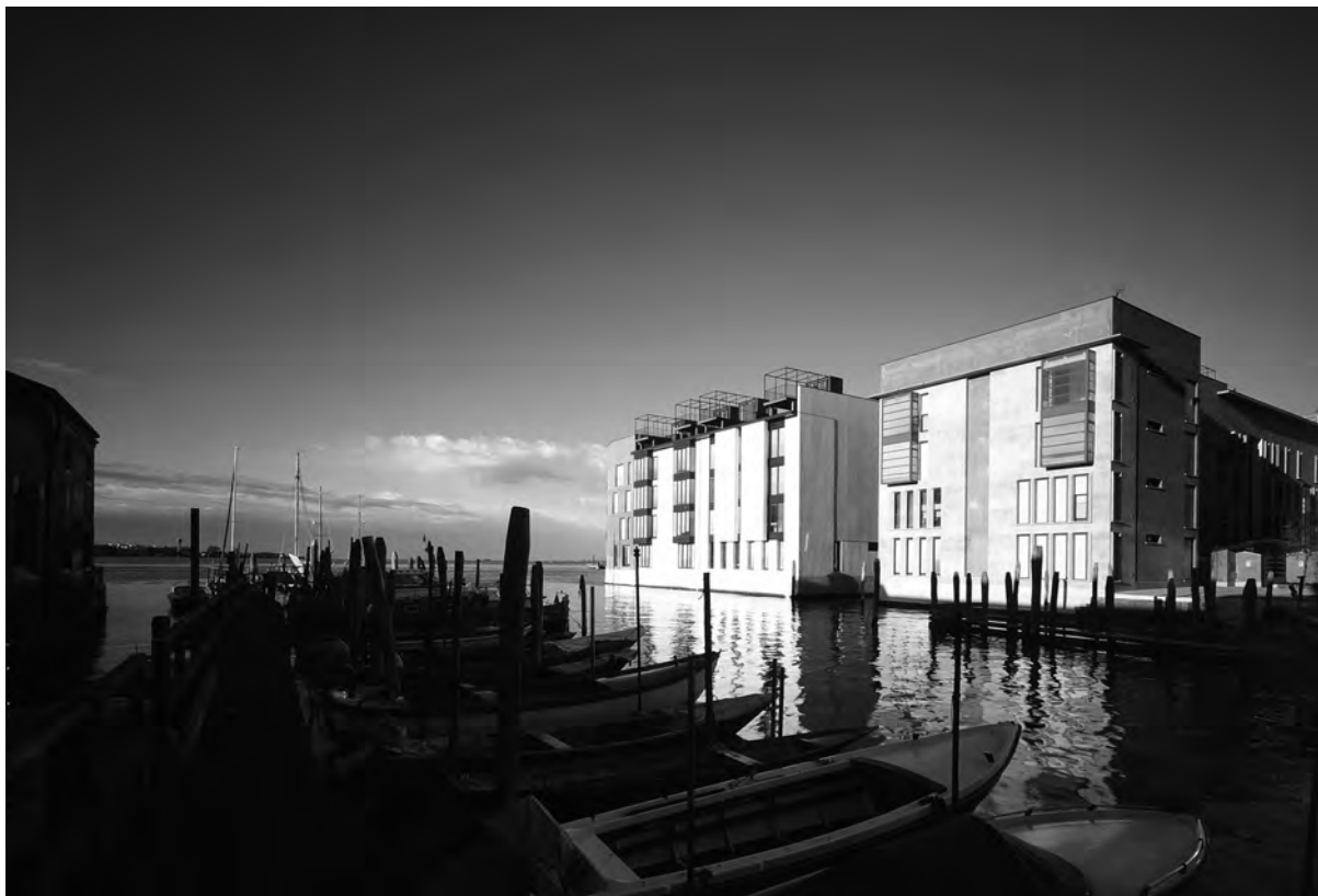
Il. 2. Budynek apartamentowy Judeca Nova, Giudecca, Wenecja.