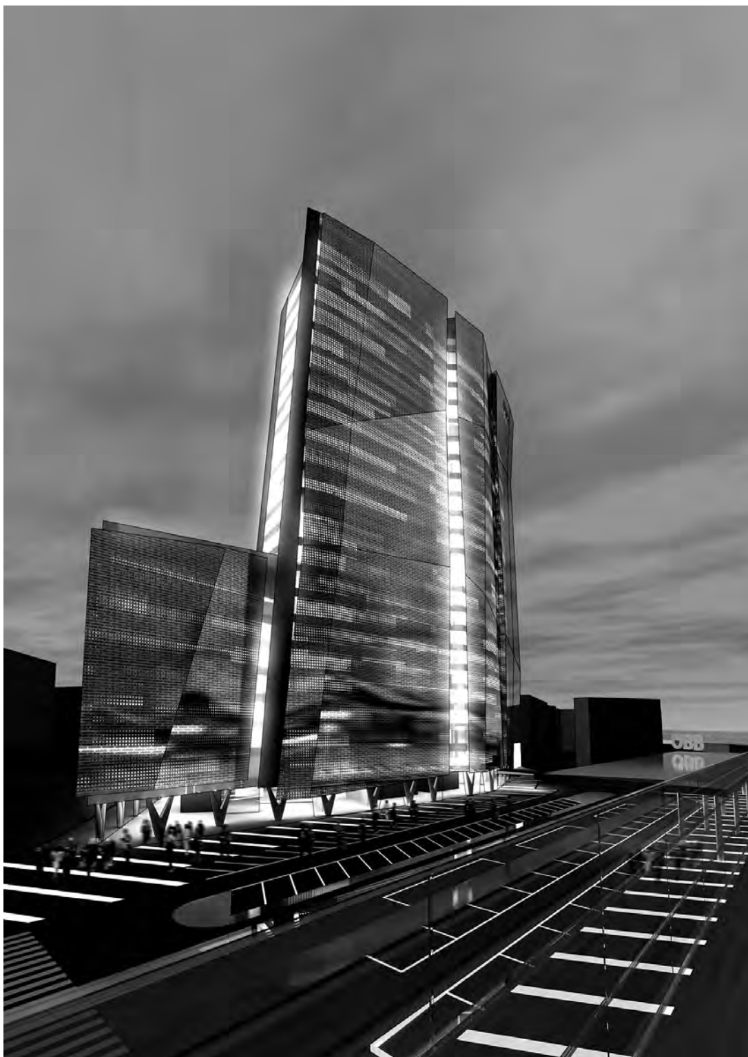
Il. 6. Budynek siedziby ÖBB, Wiedeń, projekt