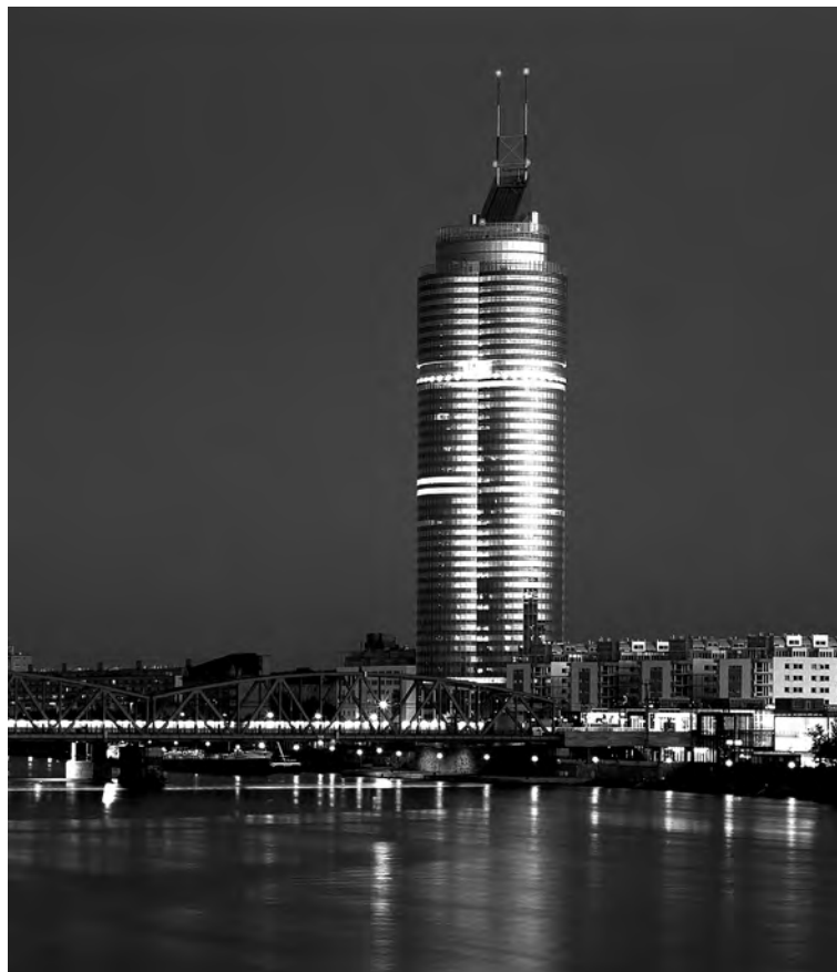
Il. 3. Milenium Tower, Wiedeń.

dynie jako usprawiedliwienie dla każdego, kto chce usytuować siebie na całkowicie odrębnej, dotkniętej ekstrawagancją pozycji.