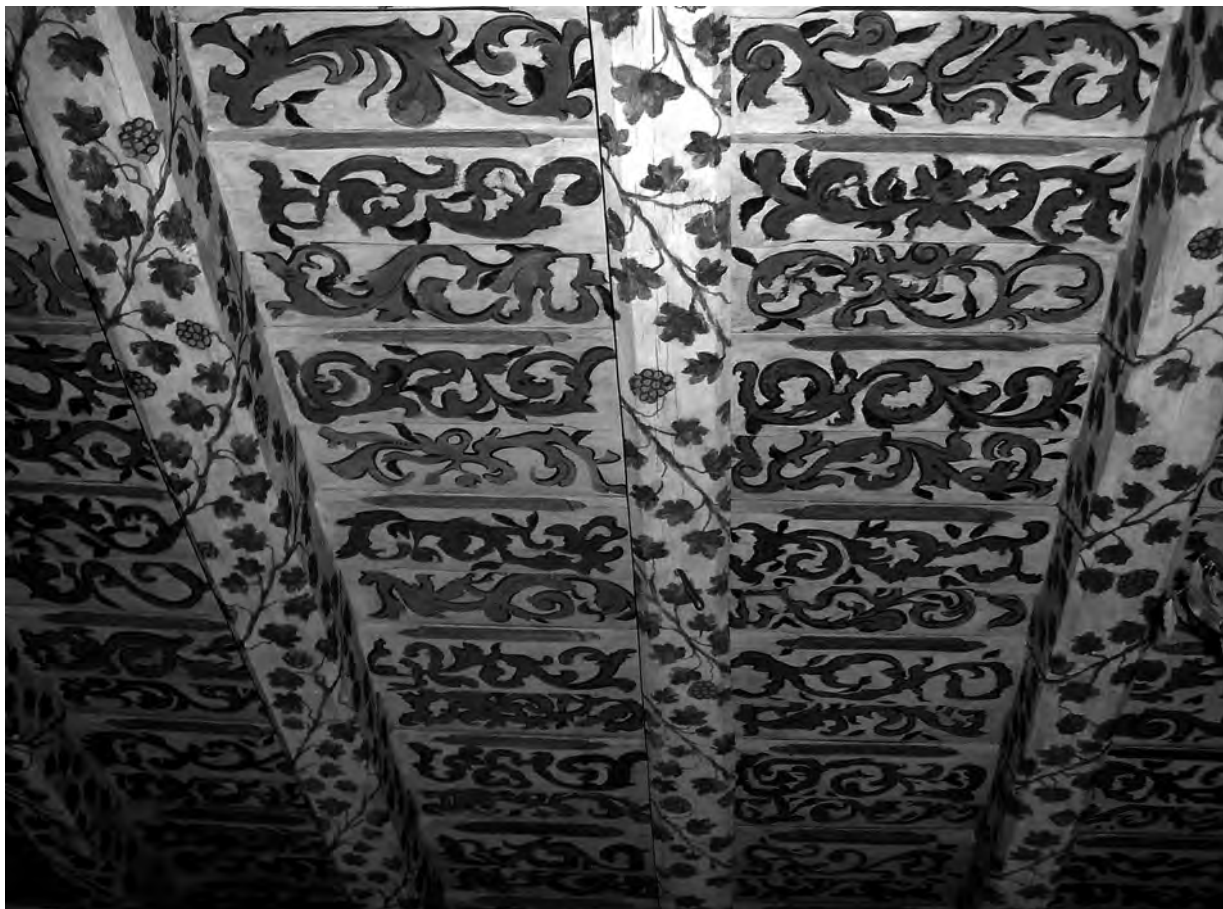
Il. 3 Fragment polichromii tzw. stropu błękitnego.

polichromowanych stropów o podobnej ornamentyce występujących na terenie Dolnego Śląska pochodzi z końca XVII i pierwszej ćwierci XVIII wieku. Dlatego również dobrze można byłoby przyjąć dla powstania omawianych zdobień okres po 1708 r. – po ponownym otwarciu kościoła dla wiernych.