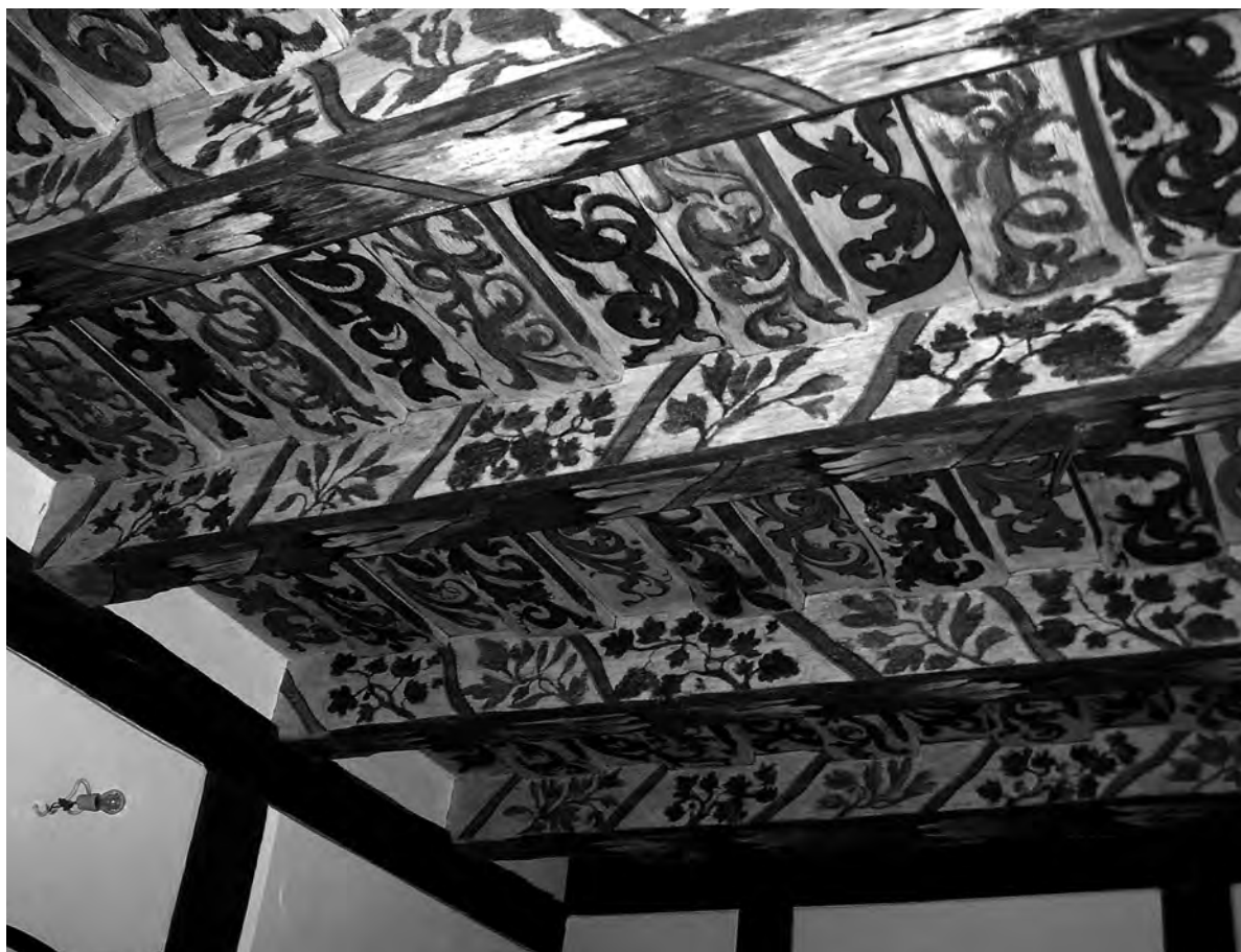
— II. 2 Fragment polichromii tzw. stropu zielonego.