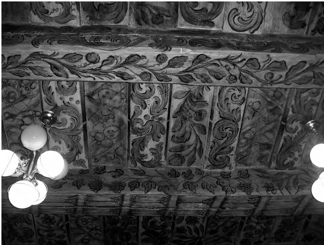
Il. 6 Strop polichromowany z 1694 r., ul. Św. Antoniego 31, Wrocław.