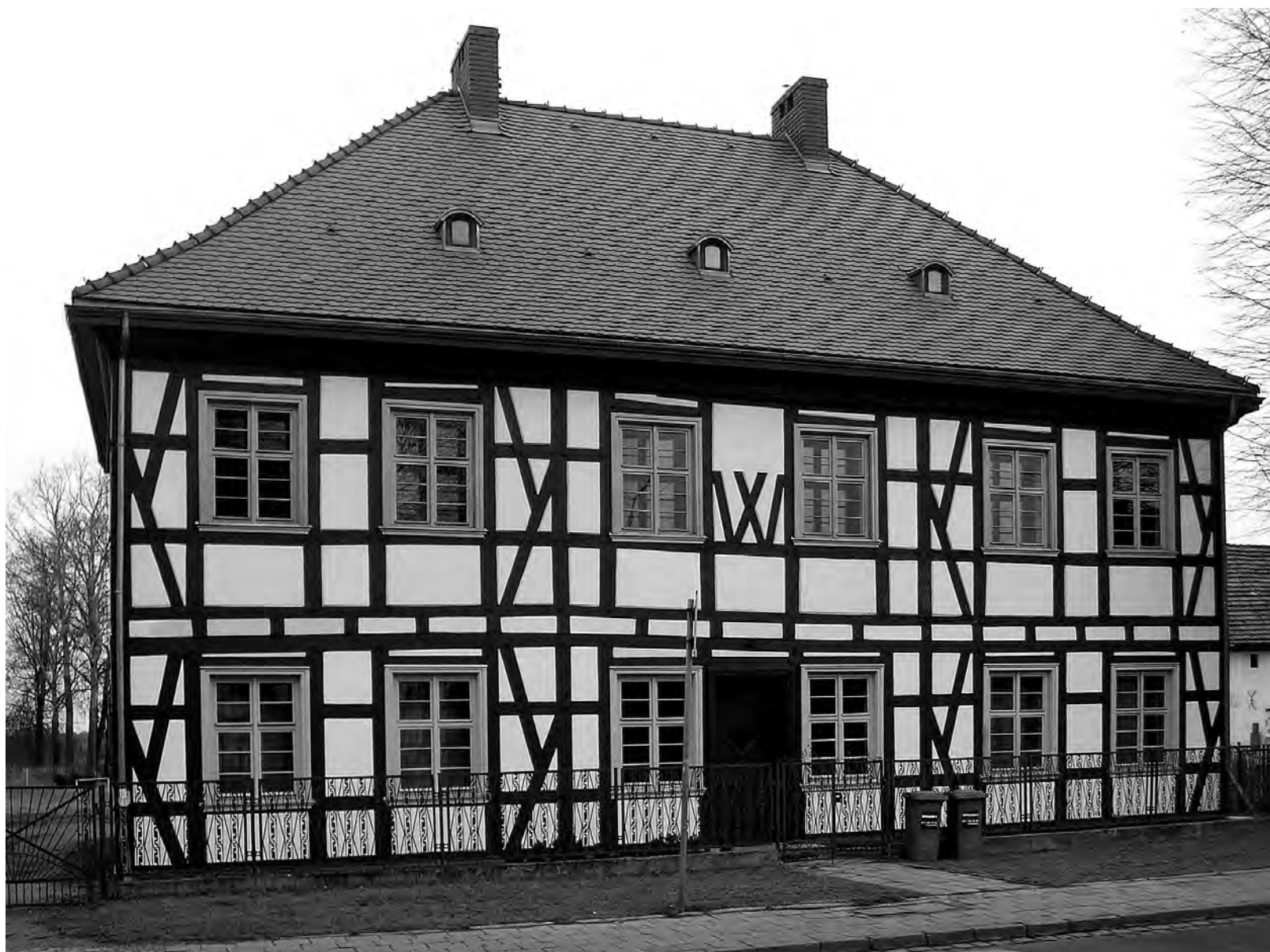
— Il. 1 Budynek plebanii z 1626 r. – na pierwszym piętrze, w dwóch pomieszczeniach, znajdują się drewniane, polichromowane stropy belkowe.