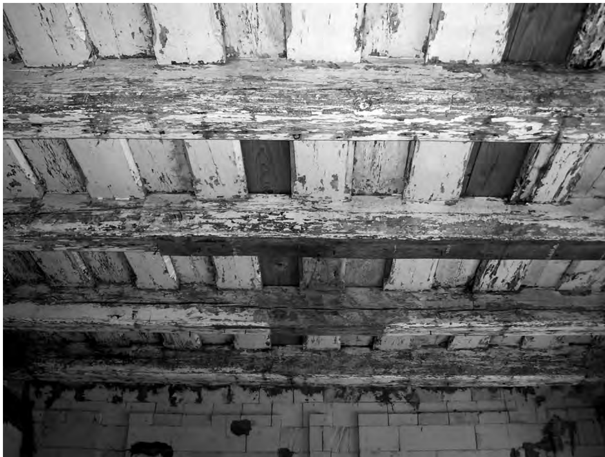
Il. 5 Stan stropu przed konserwacją.

talnych. Boki belek i wypukłych wsuwek są sfazowane i podkreślone brązem, przez co uwydatniony jest odrębny kształt wsuwek.