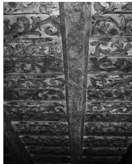
Il. 7 Strop polichromowany z XVII w., zamek w Wojnowicach, pierwotnie ul. Ruska 49, Wrocław.