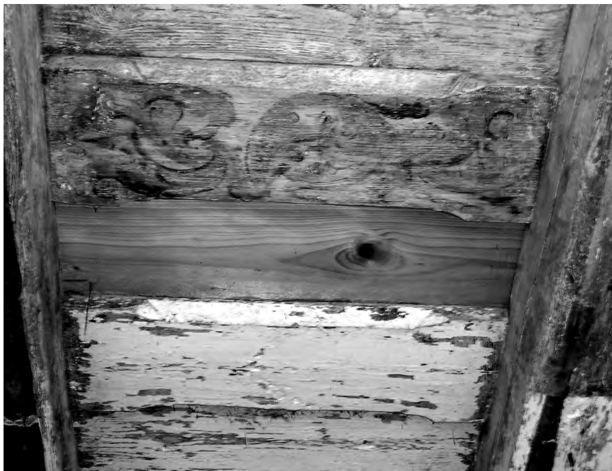
Il. 4 Fragment ornamentu przed konserwacją.

cyjach kolorystycznych: zieleni i szarości oraz zieleni i żółci, na przemian, w rzędach pomiędzy belkami nośnymi. Wić jest wyizolowana i skontrastowana z białym, kredowym tłem, przez które przebiega faktura drewna. Kontur wici – zatarty, jedynie miejscami pojawia się ciemna kreska podkreślająca esowate, skręcone kształty i nadająca stylizowanym liściom efekt trójwymiarowości. Ciemny odcień zieleni stanowi na tym stropie barwę dominującą. Stylizowane pędy roślinne tego koloru zdobią także boki belek, występując podobnie, jak na wsuwkach, w sekwencjach zieleni i żółci oraz zieleni i szarości. Pojedyncze z nich, przypominające liście winorośli, oddzielone są za pomocą ukośnych, nierównych pasów koloru jasnobrązowego (ugrowego), podkreślonych ciemnym konturem. Natomiast lica belek zdobi całkiem inny ornament, o charakterze abstrakcyjnym: skontrastowane ze sobą barwy zielona i biała oddzielone jak na bokach belek ukośnymi, żółtymi pasami, obwiedzionymi ciemnym konturem. Ornament ten przybiera formę mocno uproszczonych, płasko kształtowanych liści, palmet. Odmienny charakter zdobienia na spodnich częściach belek może wynikać z braku czytelnych form ornamen-